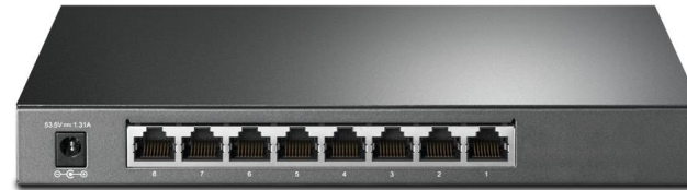
TP-LINK JetStream TL-SG2008P

24-Port Gigabit 4-Port 10GE SFP+ L2+ Managed Switch with 24-Port PoE+