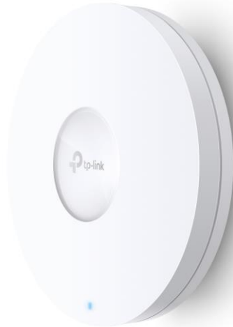
EAP660 HD (RV)