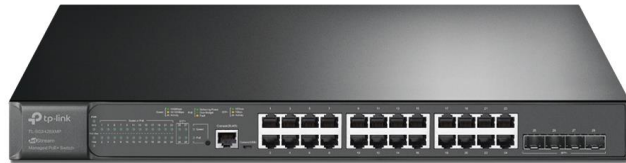
TP-LINK JetStream TL-SG3428XMP

24-Port Gigabit 4-Port 10GE SFP+ L2+ Managed Switch with 24-Port PoE+