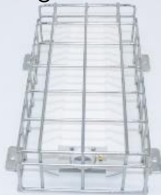
Rechteckig – 4 Wände